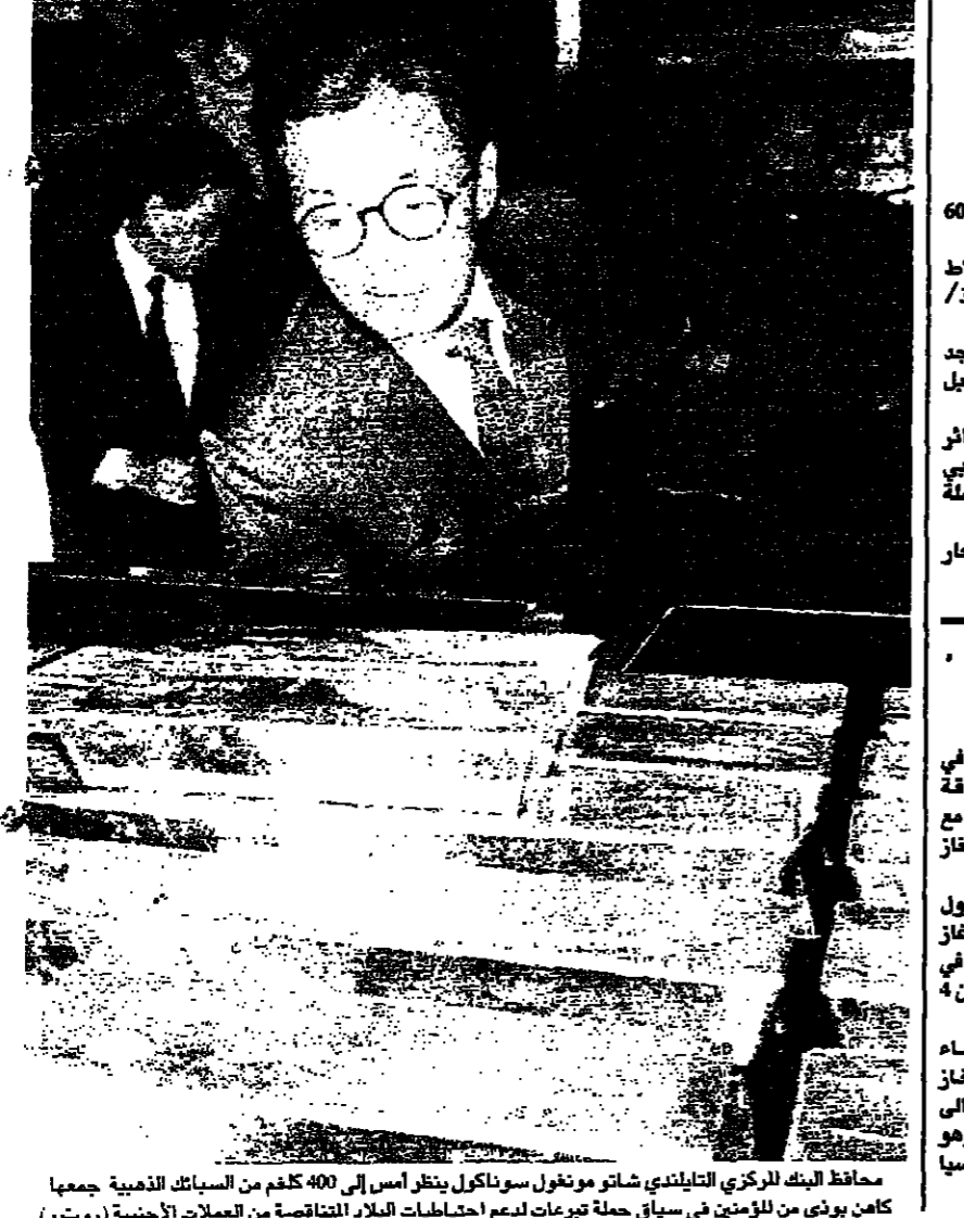
محافظ البنك المركزي اللبناني شاتو مونغول سوناكل بنظر امس في 400 كلف من الماسك الذهبية جمعها كاهن بوذي من لومنين في سيات حملة تبرعات لدعم احتياطات البلاد الناقصة من العملات الأجنبية